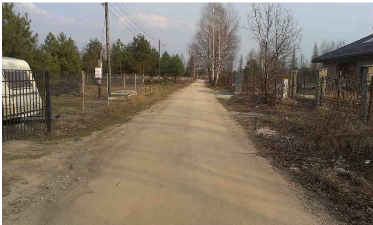
ZDJĘCIE 1. UL. SZKLARNIOWA

Droga posiada uszkodzoną nawierzchnię, z tłucznia kamiennego, dobrze zagęszczonego o grubości warstwy 0,30m. Szerokość drogi w stanie istniejącym wynosi od ok. 3,00m do 4,50m.